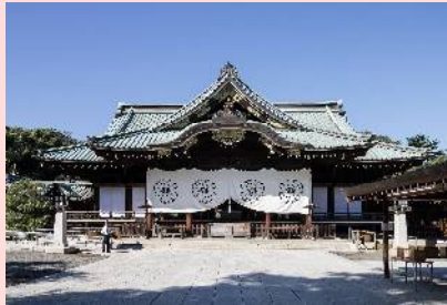
御英霊が祀られている靖国神社

座して死を待つより戦うことを選び、生きるためにやむなく開戦に踏み切ったのです。それは日本から攻撃をさせることによって自分の正当防衛を証明するため、日本を開戦