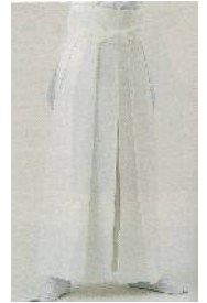
【袴】慰霊祭の時など 級に関係なく使用 (白無地)