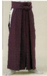
【袴】二級 (紫色の無地)