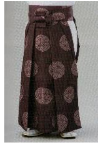
【袴】二級上 (紫地に薄い紋)