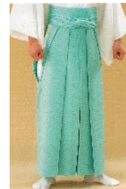
【袴】三級・四級 (浅葱色の無地)